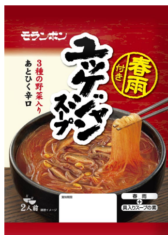
春雨付き ユッケジャンスープ