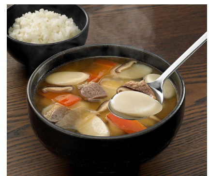
(カルビスープ 調理例)