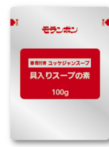
具入りスープの素 100g