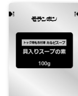
具入りスープの素 100g