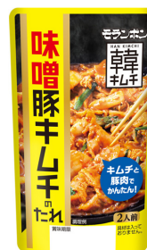
味噌豚キムチのたれ