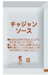
ラーメン（フライ麺）