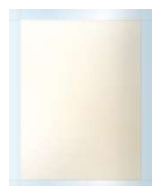
フライドチキンの素