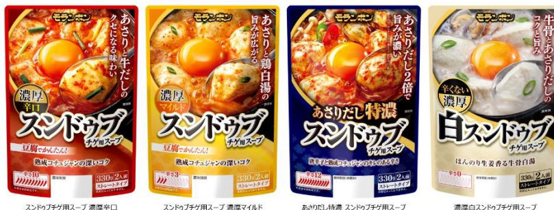
— ラインアップ —

ブランドページはこちらから https://www.moranbong.co.jp/hanshoku/concept/sundubu/