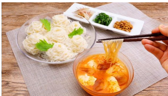
冷やしスンドゥブそうめん