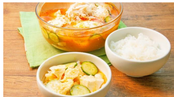
冷や汁風スンドゥブ